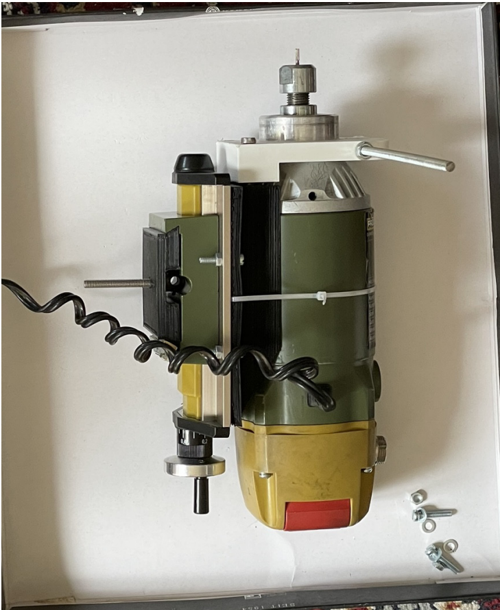
Montage du tout sur les profilé d'alu :