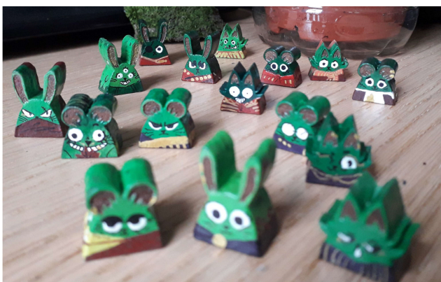
Croquis du concept