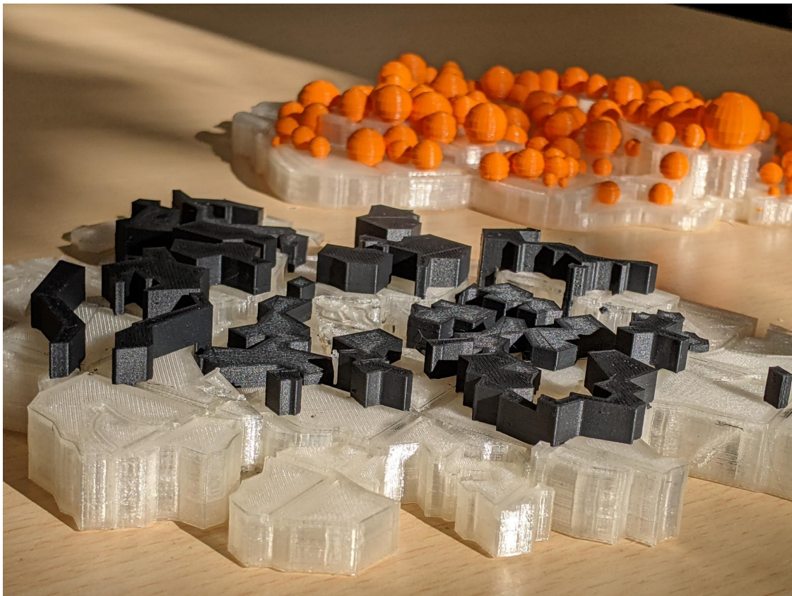
27/09/2023 - Voyage autour du Lichen (Artiste Idil Kem, projet soutenu par la DRSCS SU, impression Clara)