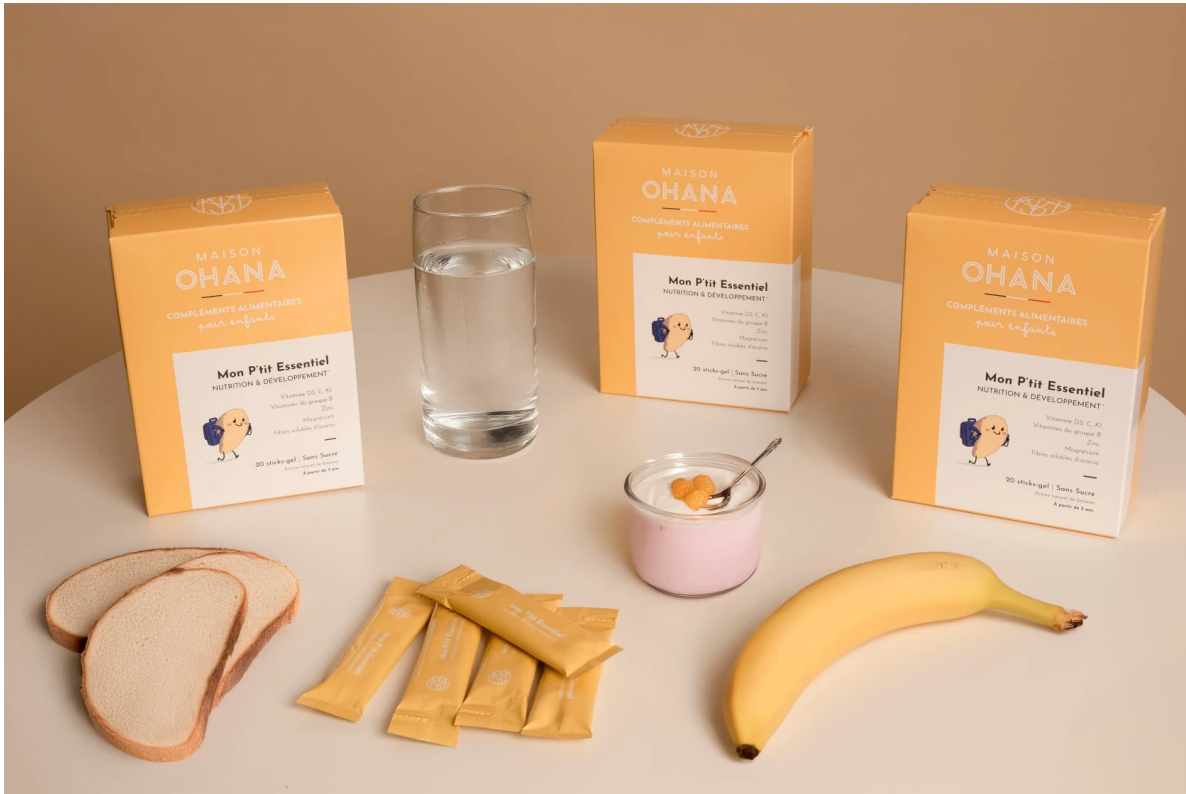
Figure 1. Complément alimentaire de la gamme Mon P'tit Essentiel - Maison Ohana.

L'objectif de ce projet est de concevoir un complément alimentaire innovant. Le travail consistera à identifier les besoins nutritionnels spécifiques des adolescents, puis à explorer et sélectionner des actifs pertinents (vitamines, minéraux, extraits de plantes, etc.). Une première base de formulation en stick gel sera ainsi définie et évaluée selon des critères de texture et d'acceptabilité sensorielle. Enfin, une démarche de sensibilisation éducative accompagnera le développement du produit.